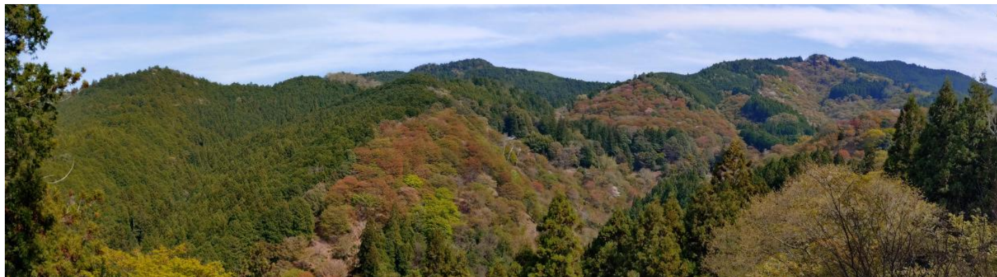
一目千本からの風景

2026 年度最初の例会は、吉野の桜と楽しみいっぱい参加しました。いつもより早い集合時間でしたが、30 名の参加がありました。1 時間 40 分臨時電車に乗ってゆったり座って行くことが出来ました。