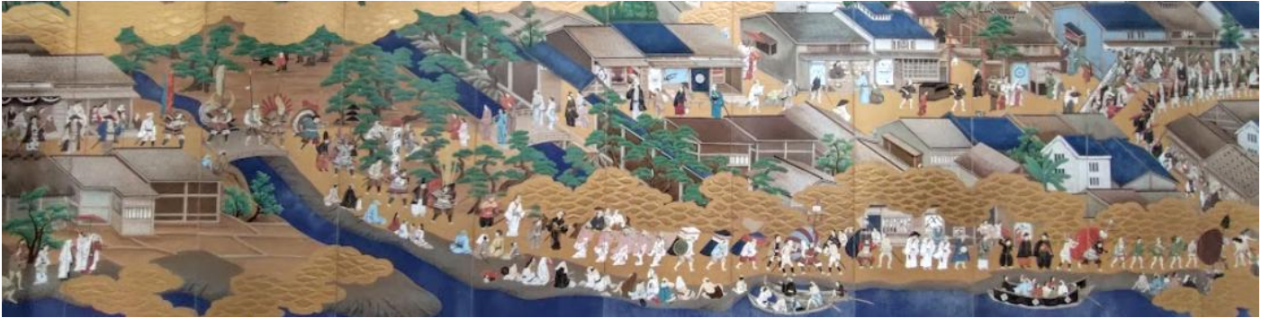
堺市役所ロビー 住吉祭礼図屏風